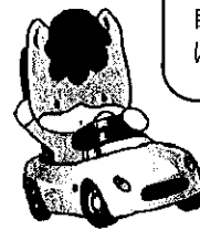
群馬県のマスコット くんまちゃん