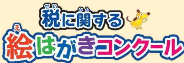
<令和4年度依頼状況>

なお、令和4年1月17日に選考が行われた令和3年度 of 受賞作品は下記の通りです。